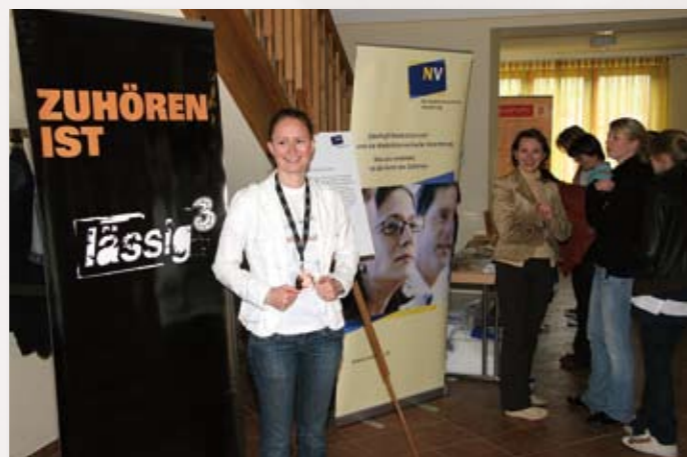
fabelhaft! ist lässig