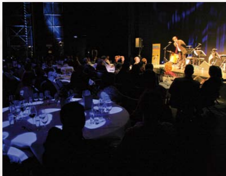
Fabien Kachev beim Story Dinner im Festspielhaus