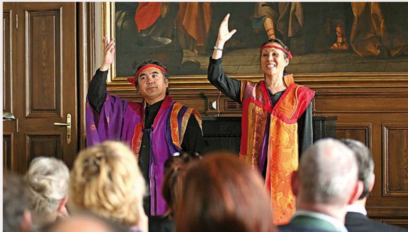
Eth-Noh-Tec im Kloster der Englischen Fräulein