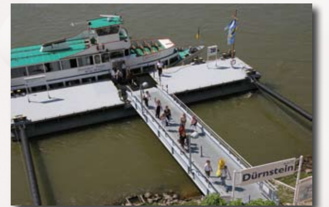
Ankunft in Dürnstein