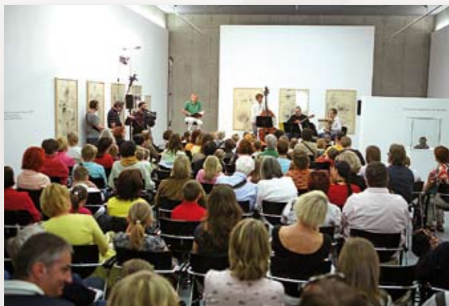
Der Mühlenelf im forum frohner