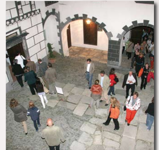
Von einem Saal zum anderen auf der Schallaburg