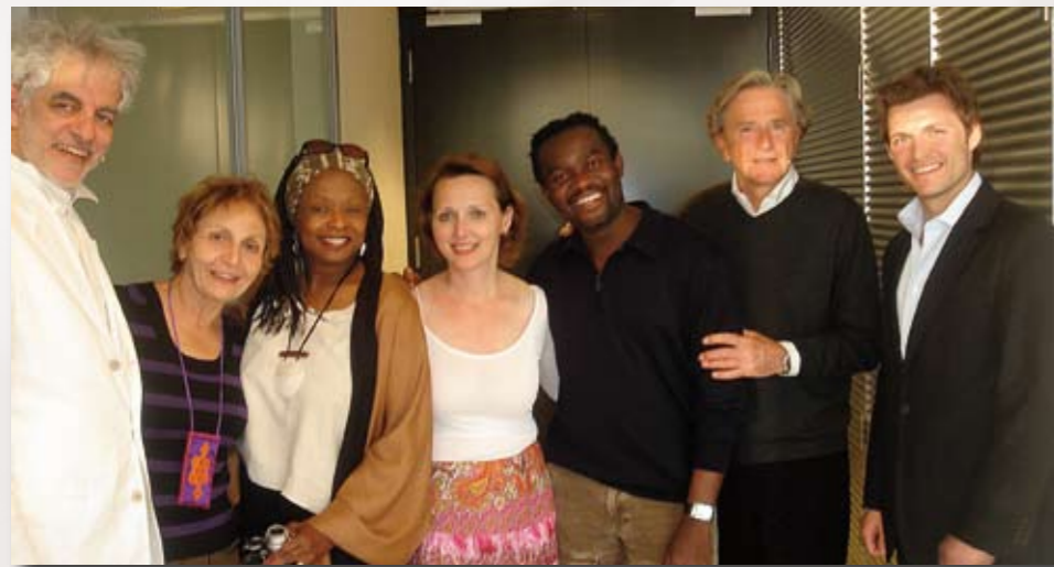
Die Verantwortlichen mit Erzählern aus Algerien, Israel, USA und Nigeria