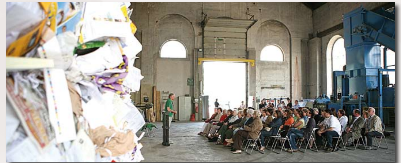
Geheimnisvolle Stadt - Im Abfallzentrum der Entsorger AVE