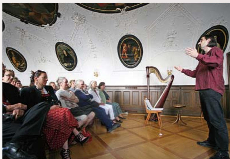
KAI bei den Englischen Fräulein