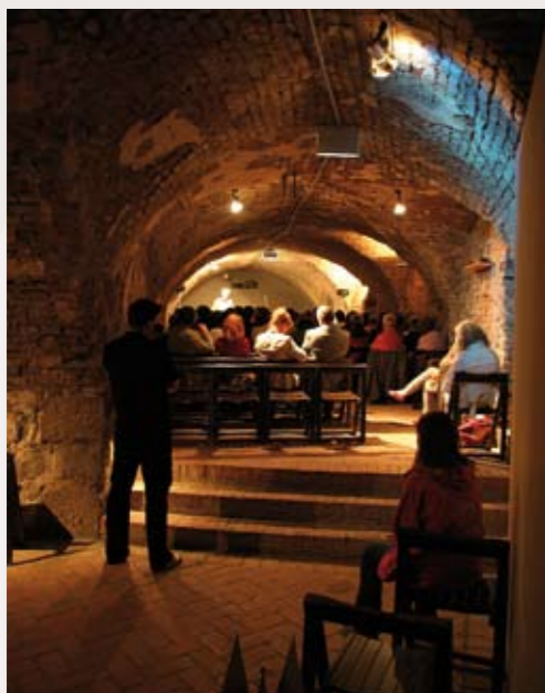
1001 Geschichten im Museumspädagogischen Raum auf der Schallaburg