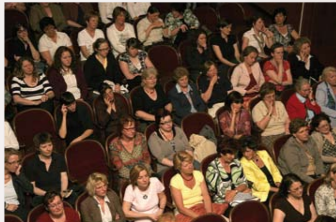
Ladies only bei der Legende von Gott Fußball