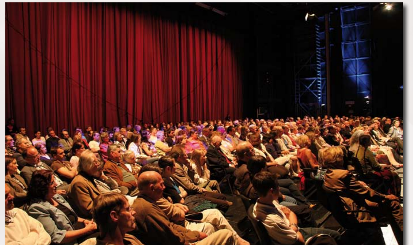
Die Lange Nacht der Märchenerzähler auf der Bühne des Festspielhauses St. Pölten