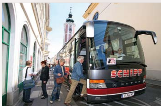
Start zu „Wenn Engel reisen“...