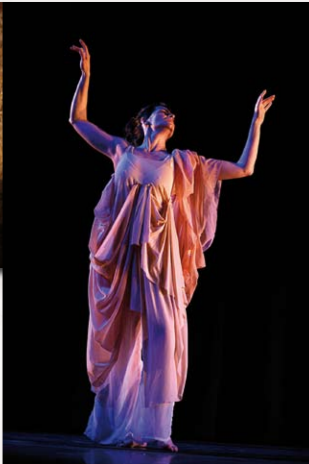
Die Eröffnung - Tanz als erzählende Kunst